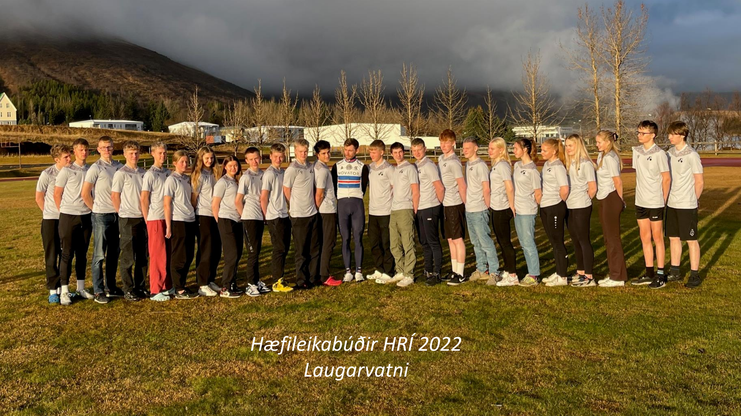
Hæfileikabúðir HRÍ 2022 Laugarvatni